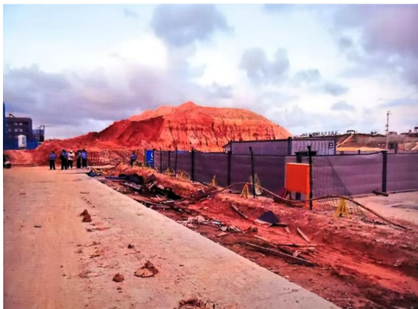
图 1 事故发生空地现场远景

象的核心责任及义务。同时清晰界定属地街道、行业主管部门的监管职责，细化从报备、审批到日常巡查的全流程监管要求，消除监管盲区，筑牢零星作业安全防线；二是要加强对铁路建设安全生产工作的督促指导协调，督促参建单位各方严格遵守法律法规和规范标准，落实各项安全生产管理和风险防控措施。科学有效组织安全生产检查，提高安全检查人员业务水平，聘请经验丰富的专家和技术人员进行定期或不定期的安全检查，对于检查中发现的重大事故隐患，及时挂牌督办；如重大隐患在排除前或者排除过程中无法保证施工安全的，要立即责令停工整改。