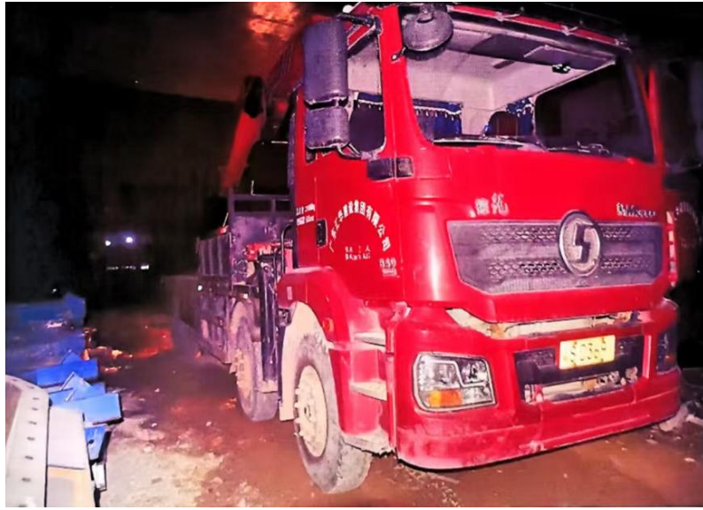
图 4 事故相关随车吊状况