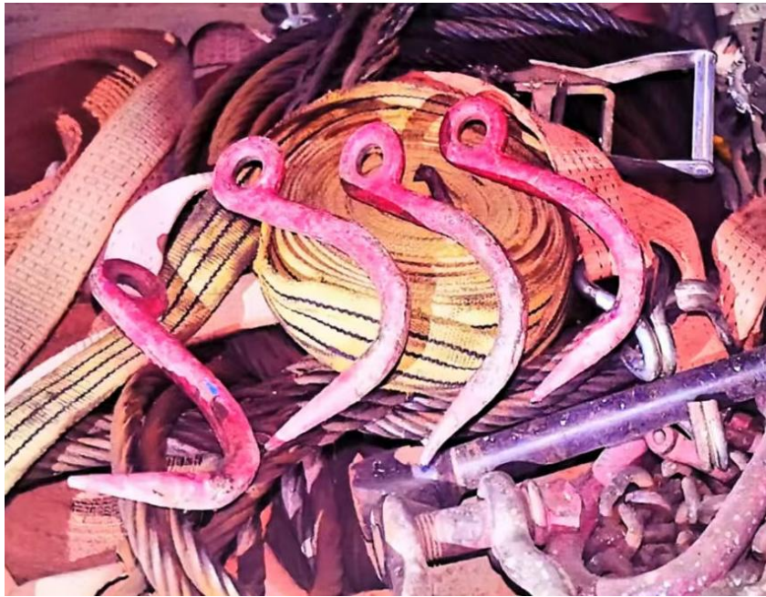
图 5 随车吊工具箱发现红色铁钩